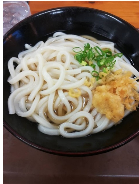
↑ 香川県で食べたうどん